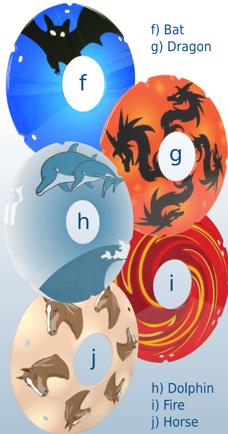
f) Bat g) Dragon