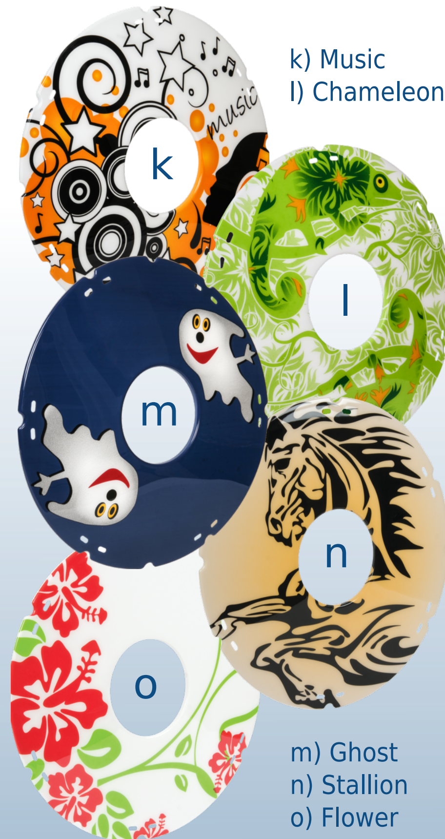
k) Music l) Chameleon