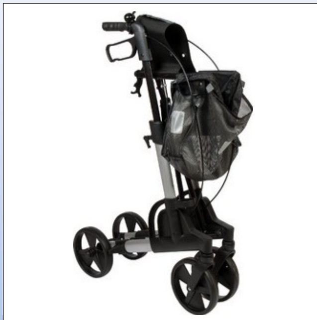
RK1b. Der "Kudu" Rollator gefaltet