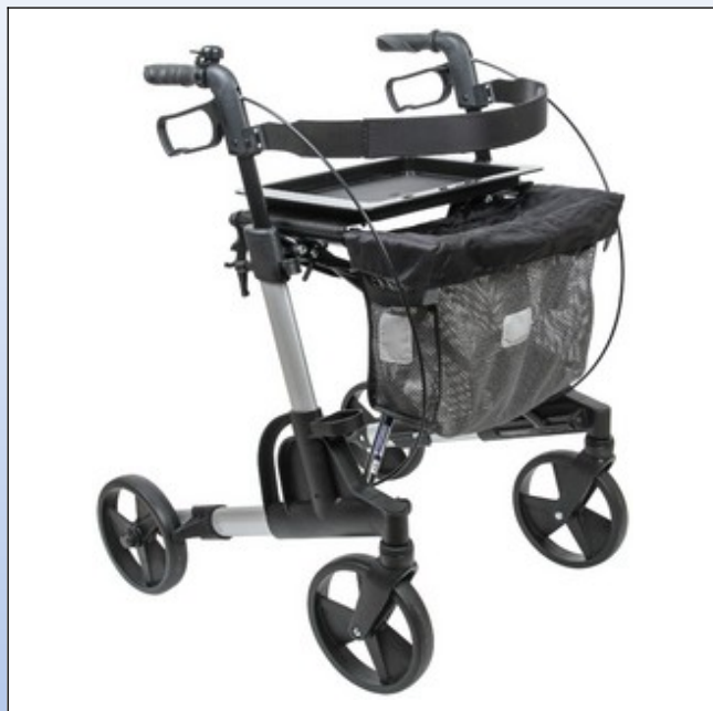
RK1a. Mobilex "Kudu" Rollator