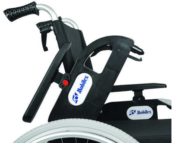
Hochklappbare und verstellbare Armlehnen