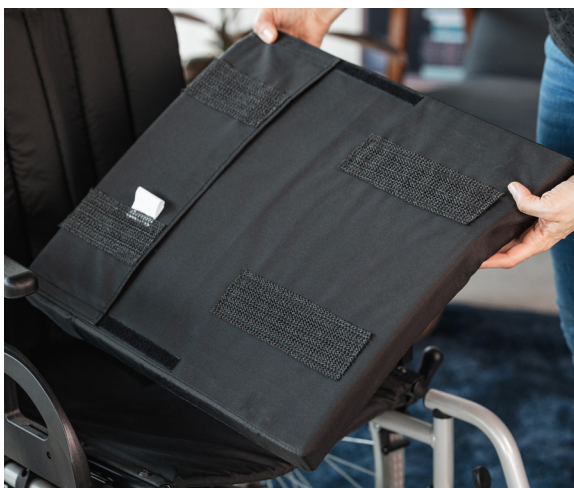
Standard-Sitzkissen mit Inkontinenzbezug