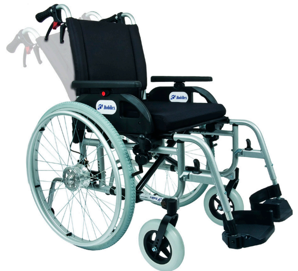
Barracuda mit Trommelbremsen