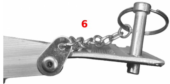
C Locking mechanism (prevents ramp from slipping away)